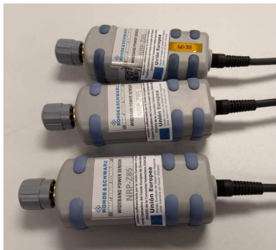
Figura 2. Tres sensores de potencia de RF de banda ancha