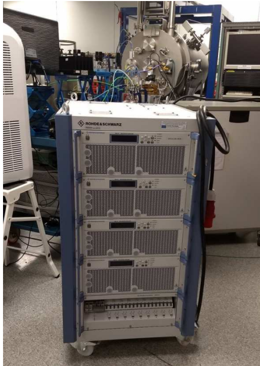
Figura 1. Amplificador de alta potencia de radiofrecuencia en banda L.